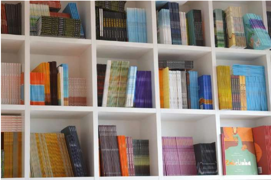
Gambar 2: Koleksi Buku

Jawa, salah satu pulau yang memiliki jumlah penerbit buku terbanyak dibandingkan pulau lain di Indonesia. Baik itu penerbit mayor ataupun penerbit indie. Banyaknya jumlah penerbit yang muncul, memberikan tawaran bagi penulis menerbitkan bukunya.