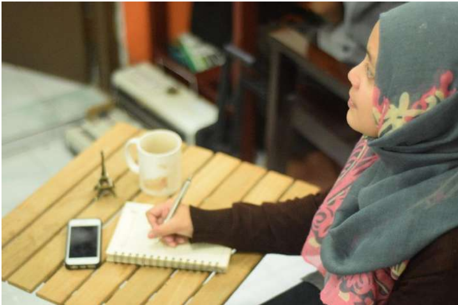
Gambar 3: Persiapan Menulis

Cara menerbitkan buku sendiri, disebut dengan self publishing . Era digitalisasi dan banyaknya persaingan antar penulis, metode self publishing salah satu cara agar tetap eksis dalam menerbitkan buku. Dengan kata lain, selain bertindak sebagai penulis buku, Anda juga sebagai penerbit buku.