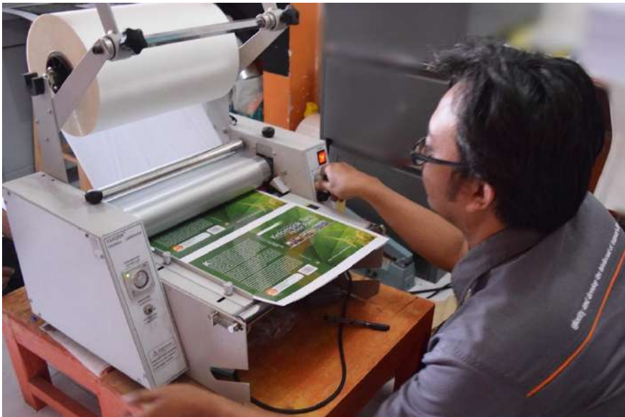
Gambar 4: Proses Produksi di Penerbit Buku