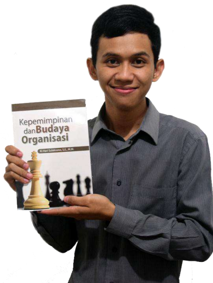
Gambar 5: Proses Pemasaran (dok: Deepublish)

Hal yang biasanya menjadi pertanyaan dan jadi pertimbangan saat akan menerbitkan buku self publishing adalah bagaimana cara menjualnya. Untuk memasarkan buku yang sudah diterbitkan melalui self publishing bisa menggunakan model pemasaran berlapis. Lapis pertama yakni memasarkan buku lewat distributor buku, agar buku kita masuk ke berbagai toko buku di Indonesia. Kelebihannya: buku kita langsung tersebar ke berbagai toko buku. Kelemahannya: perputaran uang lambat (bisa 3-6 bulan baru cair untuk tahap pertama, seterusnya tiap bulan). Kelemahan lain: distributor lazimnya minta diskon sangat tinggi (kisaran 50 % – 65 % dari harga jual buku). Lapis kedua yakni dengan cara buku kita pasarkan secara langsung, bisa oleh kita sendiri atau oleh orang-orang kepercayaan kita ke pembaca yang butuh buku tersebut. Contoh buku